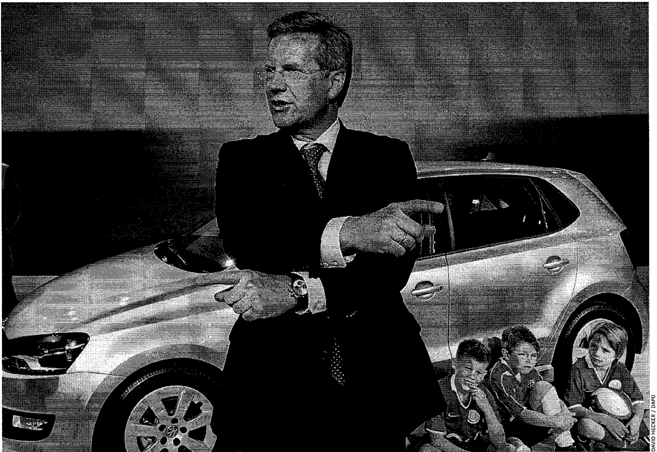
VW-Aufsichtsrat Wulff*: Anleger fordern Milliarden Euro Schadensersatz

gelten „auch solche, bei denen mit hinreichender Wahrscheinlichkeit davon ausgegangen werden kann, dass sie in Zukunft eintreten werden“.