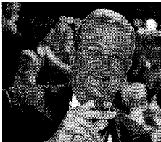
Manager Wiedeking 2010: „Kleine Blechpatscher“