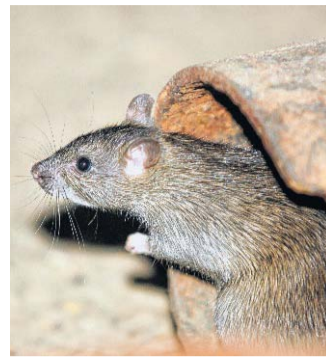
Brotkrumen haben Wanderratten angelockt.

Die Stadtverwaltung appelliert daher an alle Tierfreunde, die Enten am Riedenbach nicht mehr zu füttern. Nur so können die Ratten erfolgreich zurückge-