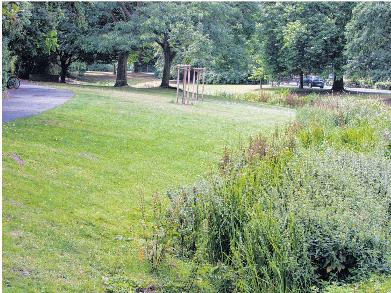
Ratten machen sich am Riedenbach breit. Auch in der Mittagszeit haben Anwohner immer wieder Nager beobachtet, die am Bachlauf entlangflitzen.

Der ist das Problem bekannt. Der Gesundheitsdienst des Landkreises ist bereits mit einer Schädlingsbekämpfungsfirma im Einsatz, auch die Verantwortlichen für die Rattenplage sind bereits gefunden: die Enten. Oder genauer gesagt: die Menschen, die die Enten füttern. „Diese falsch verstandene Tierliebe trägt wesentlich